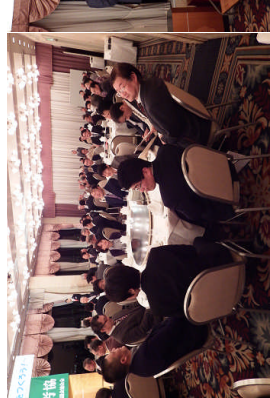
平和セ・勤労協ほか