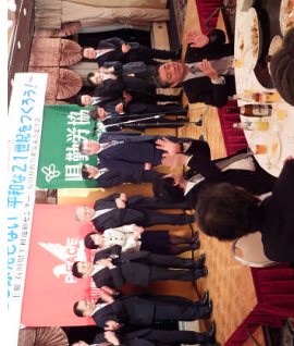
立候補予定者の当選を